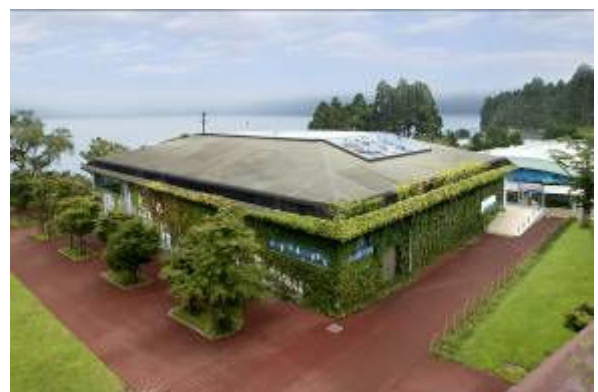
箱根園水族館外観

©本件に関する報道各位からのお問合せは 株式会社プリンスホテル 箱根 マーケティング戦略 TEL:0460-83-1130 FAX:0460-83-1213 http://www.princehotels.co.jp/amuse/hakone-en