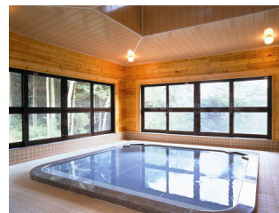
エリア内の屋根付温泉露天風呂

◎本件に関する報道各位からのお問合せは 株式会社プリンスホテル 箱根マーケティング戦略 TEL:0460-83-1130(直通) FAX:0460-83-1213