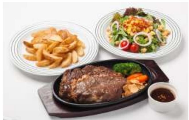
ホテルならではの本格的な味「ステーキセット」