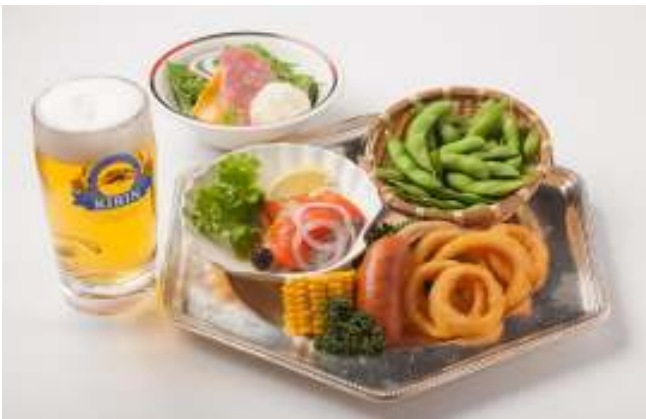
おつまみとフリードリンクが人気「涼風セット」

※8月1日(木)は料理とフリードリンクのセット(¥7,000)のみの販売とさせていただきます。