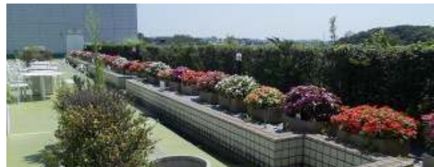
(左)7F屋上ならではの心地よいそよ風が吹くビアガーデン会場 (上)鮮やかな花色と緑が会場のアクセントに

◎本件に関する報道各位からのお問合せ 新横浜プリンスホテル 事業戦略 TEL:045-471-1113(直通) FAX:045-471-1189 URL: http://www.princehotels.co.jp/shinyokohama