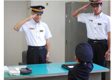
こども 1 日駅長辞令交付式 イメージ