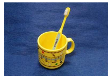
スペシャルトレインルーム特典アメニティ