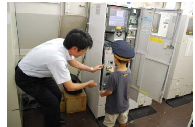
券売機の見学 イメージ