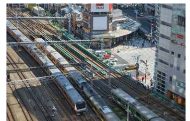
お部屋からの眺め イメージ