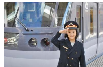
駅長体験イメージ