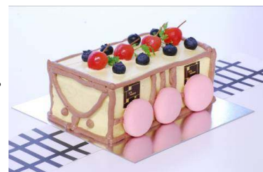
ドリームトレインケーキ イメージ

2000系をイメージした黄色のクリームの中はイチゴの入ったふわふわのショートケーキです。