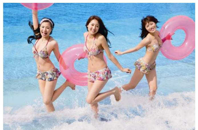
2013年 大磯ロングビーチキャンペーンガール

◎本件に関する報道各位からのお問合せ先は 大磯プリンスホテル・大磯ロングビーチ 営業(企画担当) TEL:0463-61-1111 FAX:0463-61-6281 URL:www.princehotels.co.jp/oiso/ 株式会社プリンスホテル 湘南・九州 マーケティング戦略 TEL:0463-61-1948