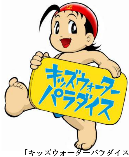
「キッズウォーターパラダイス」