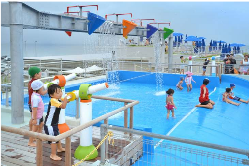
アトラクションプール「キッズウォーターパラダイス」