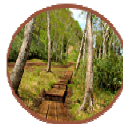
マウンテンゾーン