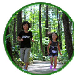
フォレストゾーン