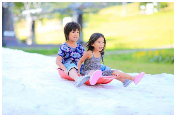
天然雪を使ったソリ遊び(イメージ)