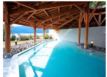
露天風呂 「箱根 湖畔の湯」イメージ