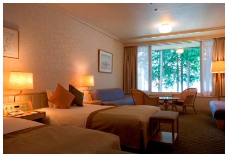
別館スーペリアツインルームイメージ