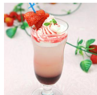
ノンアルコール ストロベリーカクテル