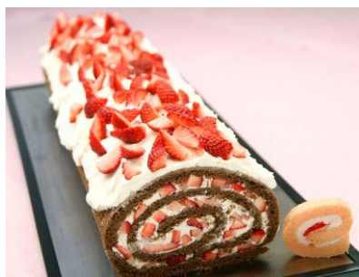
苺ぎっしりメガロールケーキ

毎月15日にアクセサリやお手荷物に「いちご柄のアイテム」(ハンカチ、キーホルダー、お召し物など)をお持ちいただくと “ ノンアルコール ストロベリーカクテル ”をサービス！