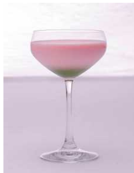
カクテル「京桜」イメージ