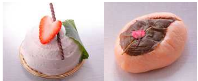
さくらモンブラン(左)、さくらもちパン(右)イメージ