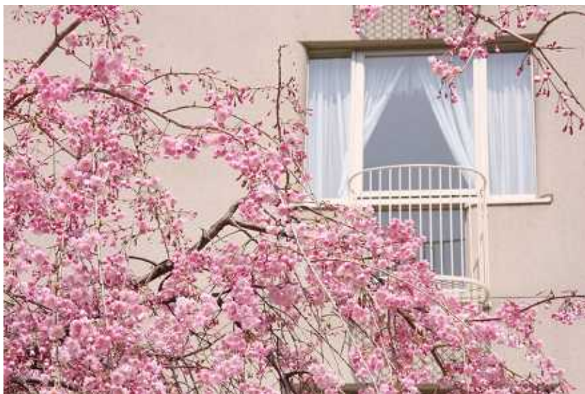
まるで桜に手が届きそう！？ホテル敷地内でも随所で桜が楽しめる

グランドプリンスホテル京都では、桜にちなんだレストランメニューや京都・大津の2つの都で桜見を楽しめる宿泊プランなど期間限定でご用意し、当ホテルでしか味わえない、五感で味わう「お花見」をご提案いたします。