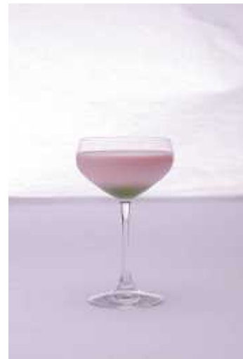
カクテル「京桜」イメージ