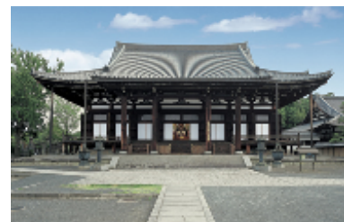
グランドプリンスホテル京都新島襄八重ゆかりの地をめぐる