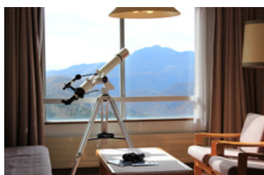
万座プリンスホテル 天体観測プラン

http://www.princehotels.co.jp/otonajikan/