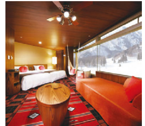
2号館暖らん ROOM・ハンモック