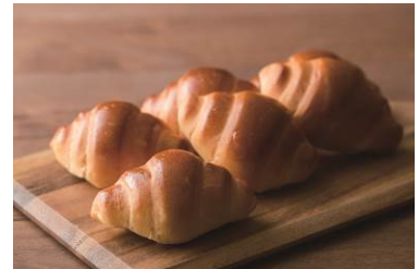
バターロールイメージ