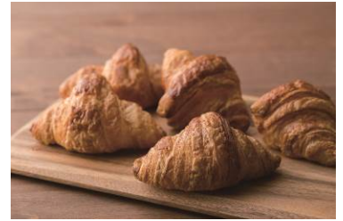
クロワッサンイメージ

小麦粉はシェフが厳選した粉を採用。長野県産牛乳、国産バターを使用した生地を低温で長時間熟成させることで小麦粉本来の風味を引き出しています。