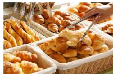
パン提供イメージ

軽井沢プリンスホテル売店のほか、他店舗(ツルヤ軽井沢店・ツルヤ御代田店)でも販売いたします。ご自宅の食卓でホテルメイドパンをお楽しみいただけます。