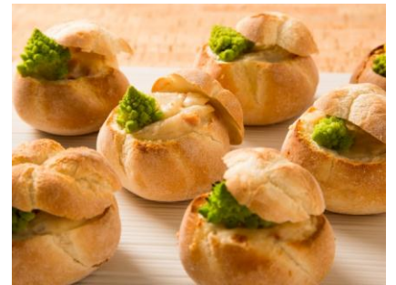
パンに詰めたびわ湖シジミのグラタンオープン焼き