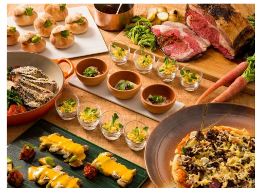
「Lake View Dining Biona」料理イメージ

◎本件に関する報道各位からのお問合せは びわ湖大津プリンスホテル 事業戦略 TEL : 077-521-2933(直通) FAX : 077-521-1114 http://www.princehotels.co.jp/otsu/