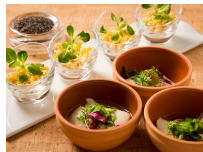
滋賀県産虹マスとホワイトソルガムきびのタブレ