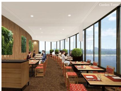
Garden Terrace(ガーデンテラス) 高台にある邸宅の緑に囲まれた中庭がイメージ 眺望のよい角の配置を生かした開放感をもつダイニング