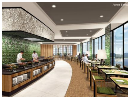
Forest Terrace(フォレストテラス) 森の中に建つ別荘のテラスがイメージ ナチュラルで優しい雰囲気 のダイニングエリア