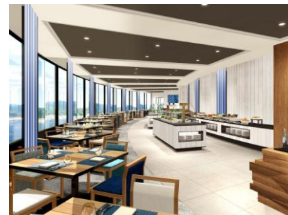
Lakeside Living & Terrace (レイクサイドリビング アンド テラス) 湖畔沿いに建つ別荘をイメージ 元気と活気を演出したダイニング