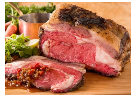
国産牛の「プライム・リブスタイル」ロースト くこの実のシャリアピンソース