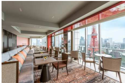
プレミアムクラブフロアにご宿泊者のみ利用できるプレミアムクラブラウンジ。