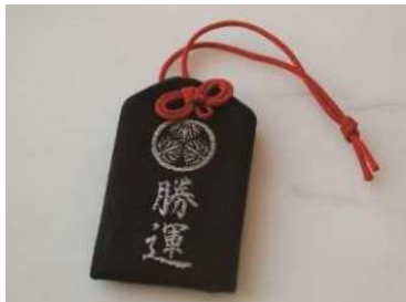
増上寺の「勝守」をプレゼント