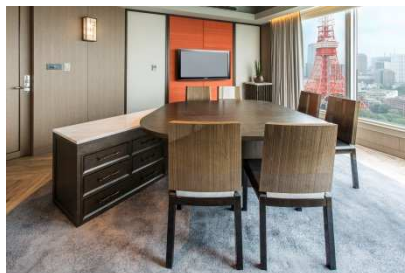
会議室も2時間まで無料でご利用可能。気分転換に場所を変えることも。