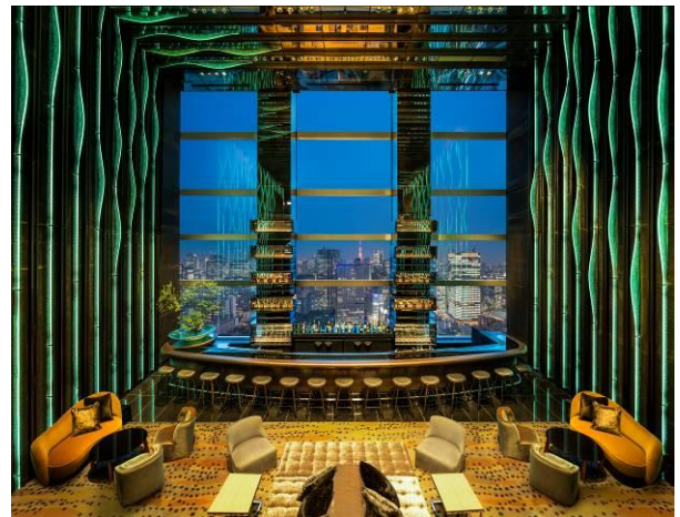
ザ・プリンスギャラリー 東京紀尾井町 35F