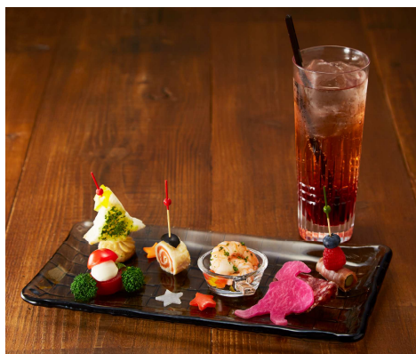
Christmas dish イメージ