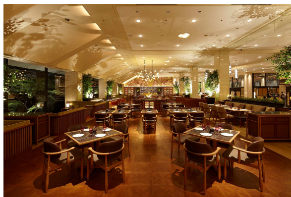
Lounge Momiji 内観

◎本件に関する報道各位からのお問合せは 株式会社プリンスホテル 高輪・品川マーケティング戦略 TEL: 03-3447-1133(直通) FAX: 03-3473-1115