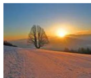
サンライズツアー・コース (イメージ)