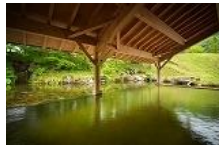
【雫石高倉温泉 屋根付き温泉露天風呂】