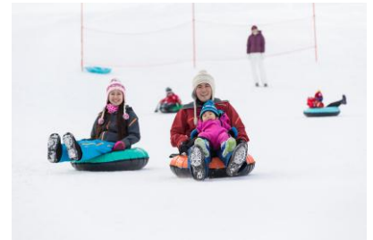
Shizukuishi スノーランド チュービングパーク(イメージ)

スノースライダー/ポーラカールセル ※上記の入場料ですべての設備をご利用いただけます。