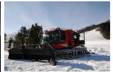
雪上車で行く星空観察ツアー(イメージ)