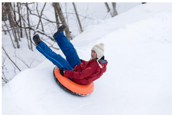
総延長 500m のチュービングパーク(イメージ)

北東北の雪をベースにさまざまなアクティビティーにより、スキー場を活用した非日常体験を提供いたします。