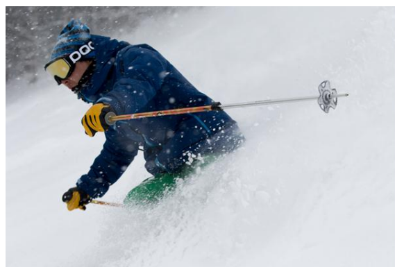
パウダースキーツアー(イメージ)