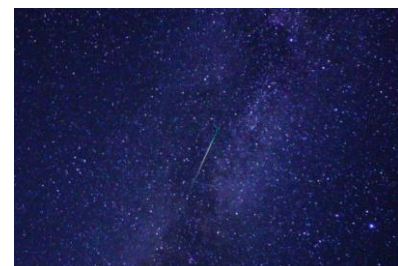
雫石の流れ星(中央部・イメージ)