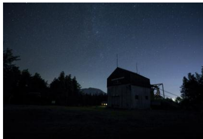
雫石の星空(イメージ)