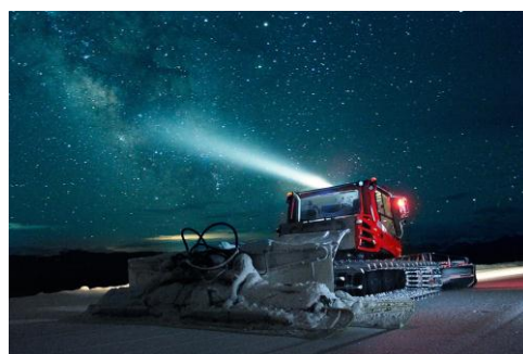
星空観察ツアー(イメージ)

◎本件に関する報道各位からのお問合せは 雫石プリンスホテル 事業戦略 http://www.princehotels.co.jp/shizukuishi TEL:019-693-1114 FAX:019-693-2336