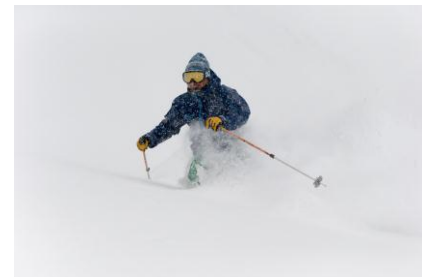
パウダースキーツアー(イメージ)