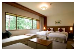
イーストツインルーム