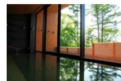
フォレスト ホット スプリング