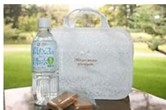
温泉おでかけバッグ

○セルフサンドイッチやスープ、デザートの特典メニューのルームサービス ↓ チェックアウト 12:00NOON ↓ 軽井沢駅「スマイルコンシェルジュ」にてお荷物をお預かり。お買い物や温泉を身軽に。 ↓ 軽井沢・プリンスショッピングプラザ ↓※お客さまご自身でご移動いただけます。 (ホテルより車で約15分) ○千ヶ滝温泉 ↓※お客さまご自身でご移動いただけます。 (ホテルより車で約15分) 軽井沢駅 ↓ 帰路 ○ご自宅に宅配便でおみやげをお届けします。 中身は届いてからのお楽しみ。