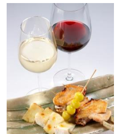
ブロシェットとワイン (イメージ)

※上記料金には、コース料理とワイン6種、消費税が含まれております。別途サービス料(10%)を加算させていただきます。 ※仕入状況により、食材・メニューに変更がある場合がございます。 ※食材によるアレルギーがございましたら、あらかじめ係へお申し付けください。