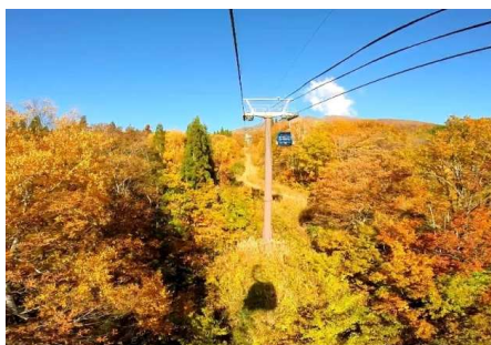
紅葉を駆け抜けるゴンドラ

全長 3,074m、標高 1,489m の山頂駅まで片道 18 分、ゴンドラキャビンから手が届きそうな紅葉の中で天空遊覧をお楽しみいただけます。また、山頂駅近くのビュースポットの展望デッキからは、眼下には野尻湖、そして正面には北信州の山々を望み、遠く富士山が見えることもあります。さらに、山頂駅周辺には、「赤倉山南麓湿原遊歩道」が整備され、ブナやナラなど多くの広葉樹が自生しており、手つかずの自然の神秘的な光景をお楽しみいただけます。お食事は山麓駅舎横のレストランで、山頂ではドリンク中心にご提供させていただきます。またオープニングイベントとして 10 月 1 日・2 日は地元野菜の直売会を開催します。妙高周辺は、これまでの苗名滝、いもり池、笹ヶ峰高原、燕温泉、関温泉など紅葉の名所に妙高杉ノ原ゴンドラが加わったことで、より一層魅力的になった紅葉スポットとなります。