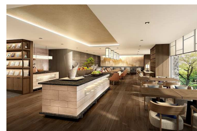
クラブラウンジ(イメージ)

訪日外国人旅行者の長期滞在等を想定し、24 時間オープンジムのジムを新設いたします。