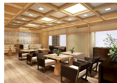
ラウンジ 桜彩(イメージ)