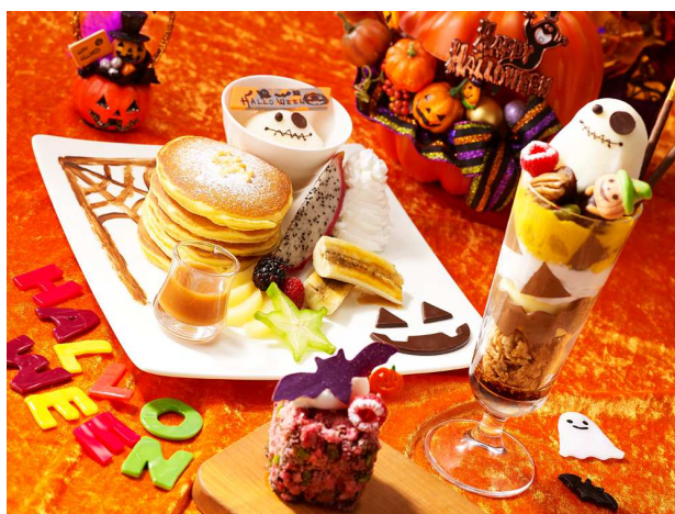
「コーヒーラウンジ マウナケア」ハロウィンスイーツ イメージ

©本件に関する報道各位からのお問合せは 株式会社プリンスホテル 高輪・品川マーケティング戦略 TEL: 03-3447-1133(直通) FAX: 03-3473-1115