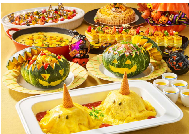
「レストラン マルモラーダ」ランチbuffet イメージ

品川プリンスホテルでは、「コーヒーラウンジ マウナケア」にて、かぼちゃクリームやキャラメルアイス、アーモンドキャラメリゼなどを使用し、お化けの顔がアクセントの「ハロウィンスプーキーパフェ」や、マウナケアで人気のパンケーキにドラゴンフルーツやスターフルーツ、ブルーベリーなどたくさんのフルーツを添え、キャラメルソースでお召しあがりいただく「トリック オア パンケーキ」をご用意いたしました。