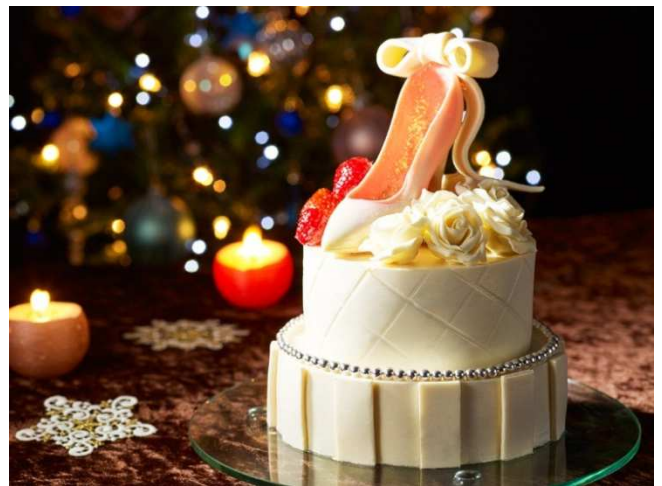
素敵でいたい女性のお気持ちを表現した「Un pas de plus (アン パドゥ プリュス)」