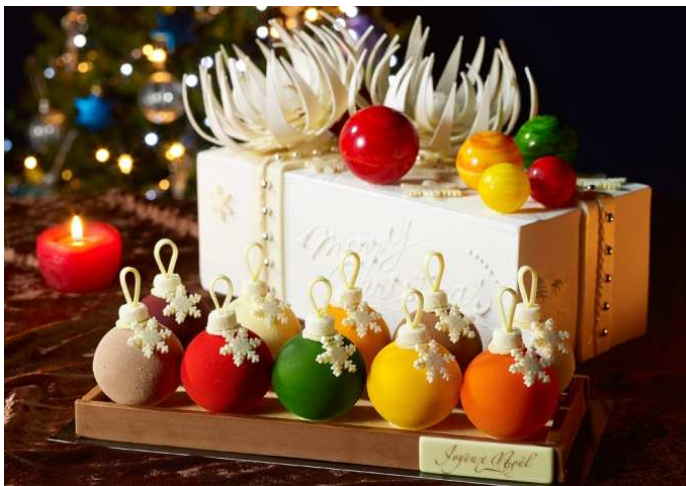
クリスマスツリーへの飾りつけをイメージした「ORNAMENT BOX」

また、街中がきらめくクリスマスに、いつも素敵でいたいと願う女性への応援メッセージを込めて、「いい靴はいい場所へ連れて行く」という言葉をヒントに、女性らしく輝くラッキーアイテムの象徴でもある靴を大きくあしらったケーキや、クリスマスの愉快な仲間たちをモチーフにしたカップケーキなどを販売いたします。