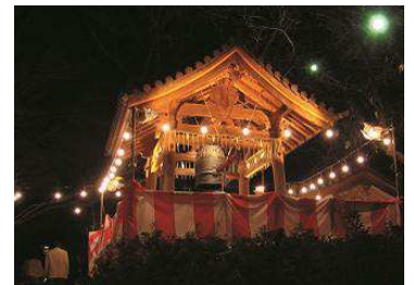
日本庭園の鐘 (大晦日)