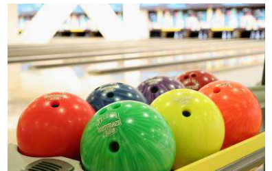
ボウリング イメージ

※そのほか、和太鼓演奏、獅子舞、もちつき大会、日本酒飲み比べ、富くじ、初詣バスの運行や「エンタメチケット」でお楽しみいただける大福茶、似顔絵、日本画ワークショップなども実施いたします。