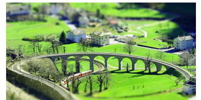
鉄道ジオラマ イメージ