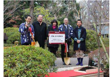
新年植樹会 イメージ