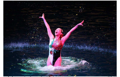
昨年のカウントダウンシンクロショーの様子