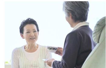
シニアケアサービス イメージ