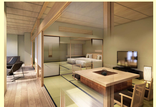
グランドプリンスホテル高輪 別館 (イメージ)