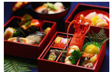
おせち料理 イメージ

※そのほか、イヤーエンドプレミアムbuffet、カウントダウンパーティー、貴賓館コンサート、新春福引き抽選会、歴史探訪街歩き、アロマオイルハンドマッサージ、新春もちつきショー、大書文字パフォーマンス、初詣バスの運行なども実施いたします。