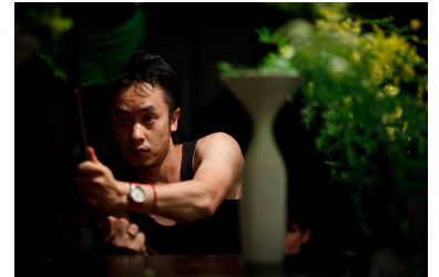
花いけバトル イメージ