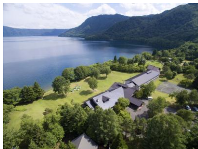
十和田湖と十和田プリンスホテルの俯瞰