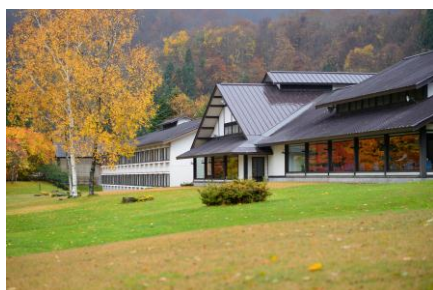
紅葉の十和田プリンスホテル