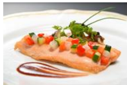
十和田キュイジーヌディナー(イメージ) 十和田湖ひめすを加えたコースディナーです。