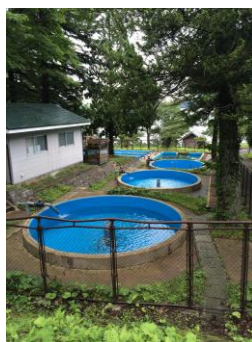
十和田湖ひめます ふ化場