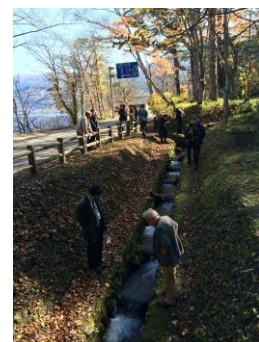
魚道のひめますを 間近に見る