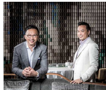
AB Concept PRINCIPAL

(*主な実績) W 北京、W パリ、ルネッサンスハーバービュー・ホテル 香港、 シャングリ・ラファールイースタンプラザホテル 台北など