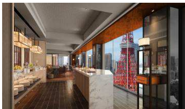
プレミアムクラブラウンジ イメージ