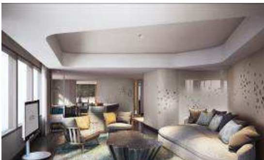
プリンセススイート リビング イメージ