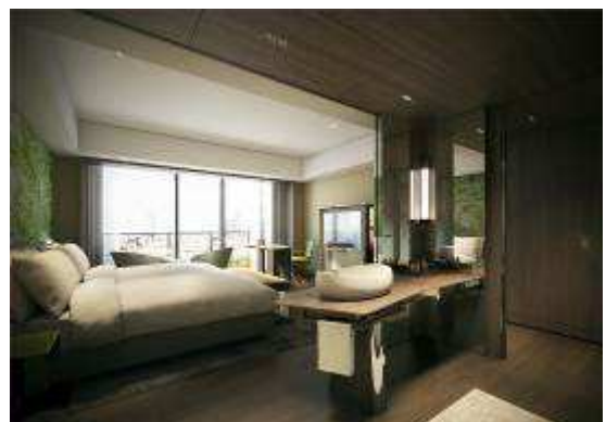
プレミアムキング イメージ