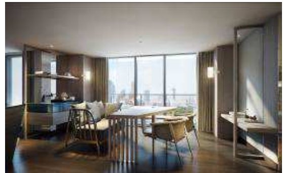
プリンセススイート ダイニング イメージ