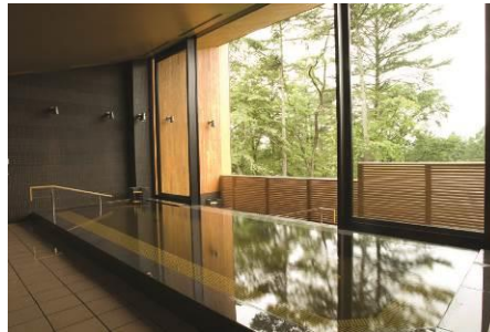
フォレスト ホット スpring