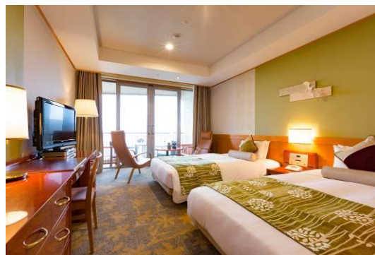
軽井沢 浅間プリンスホテル コンフォートツインルーム

◎本件に関する報道各位からのお問合せ 軽井沢地区 事業戦略(マーケティング戦略) TEL:0267-42-8115 FAX:0267-42-8118