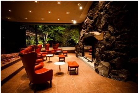
ザ・プリンス 軽井沢 ロビー