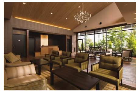
ゲストサービスセンター スマイルコンシェルジュ