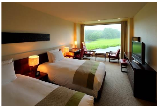
ザ・プリンス 軽井沢 スーペリアツインルーム

※上記料金には、1泊室料、朝食または夕・朝食代、『広岡浅子』プライベートツアー代金、サービス料・消費税が含まれております。