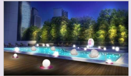
CanCamによる装飾イメージ