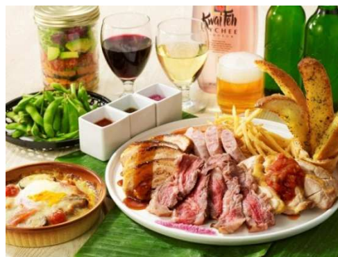
「いちょう坂ビアガーデン アウトドアテラス」のメニュー(イメージ)