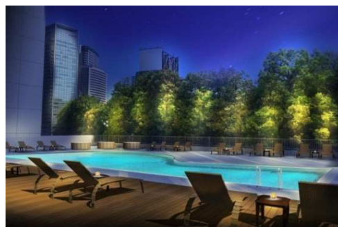
品川プリンスホテル 屋外プール(イメージ)

©本件に関する報道各位からのお問合せは 株式会社プリンスホテル 高輪・品川マーケティング戦略 TEL: 03-3447-1133(直通) FAX: 03-3473-1115