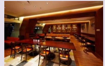
カフェレストラン 24

※各料金には、プール利用(屋内プール含む)、ロッカー利用、消費税が含まれております。