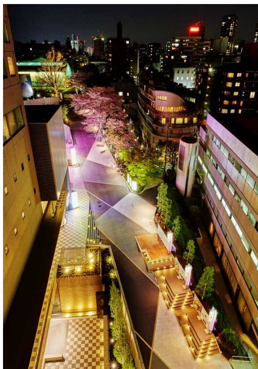
夜の「いちょう坂」(イメージ)

品川駅から高輪の街方面に向かって伸びるシンボルロード「いちょう坂」を中心に夏の夜を楽しむイベント・サービスを拡充することで、エリアの回遊性を高め、ホテルを中心としたエンターテインメント「タウン」としてさらなる進化を図ってまいります。