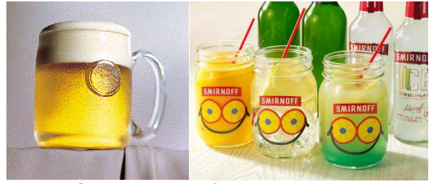
「いちょう坂ビアガーデン アウトドアテラス」のドリンク(イメージ)

※仕入れの状況により、食材、メニューに変更がある場合がございます。※食材によるアレルギーなどございましたら、あらかじめ係へお申し付けください。