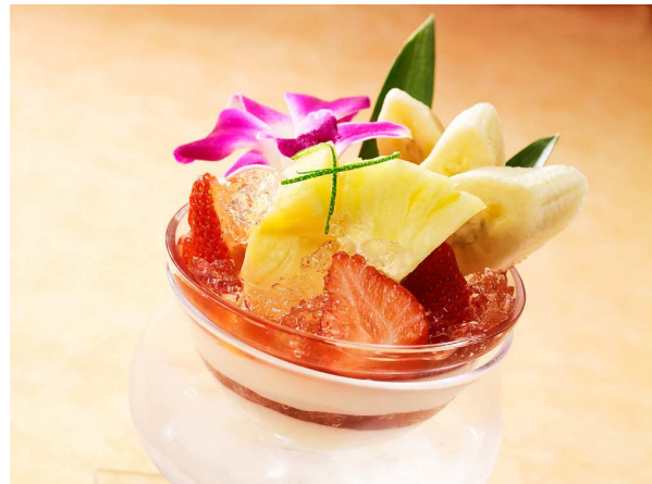
ハワイマムのハウピアパフェ