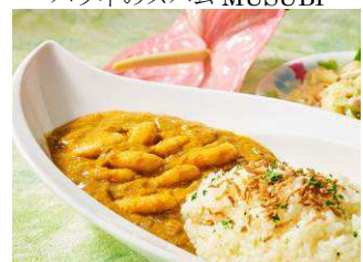
ココナッツ風味のシュリンプカレー