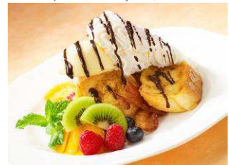
ダイヤモンドヘッド仕立てのフレンチトースト