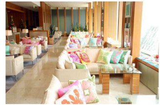
ハワイアンラウンジ イメージ

【名称】ハワイアンラウンジ 【場所】ザ・プリンス パークタワー東京 ロビーラウンジ(1F) 【期間】2016年7月1日(金)～8月31日(水) 【時間】9:00A.M.～9:00P.M.(L.O. 8:30P.M.) 【席数】125席 【お客さまからのお問合せ】ザ・プリンス パークタワー東京 TEL: 03-5400-1111(代表)