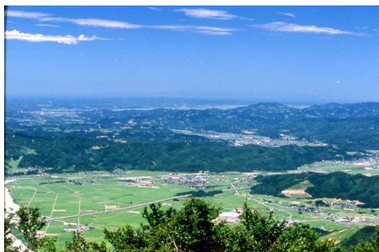
【展望台からの眺望(佐渡島方面)】