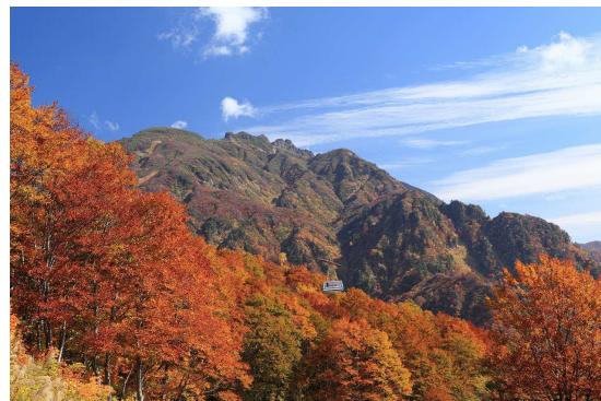
【10月中旬からはじまる山々の紅葉】

◎本件に関する報道各位からのお問合せは 八海山ロープウェイ(六日町八海山スキー場) TEL:025-775-3311 FAX:025-775-3173 http://www.princehotels.co.jp/amuse/hakkaisan