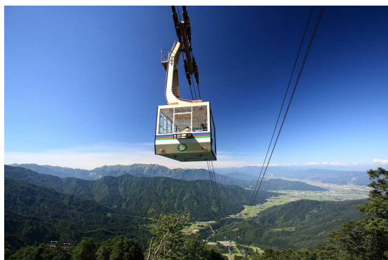
【夏の八海山ロープウェイと魚沼平野】

「八海山ロープウェイ」は、越後三山の一つである霊峰八海山(海拔1,778m)の西側斜面に位置しており六日町八海山スキー場内の全長2,217m、81人乗りのロープウェイです。グリーンシーズン中は観光ロープウェイとして運行し、眺望を楽しむ観光客や登山・トレッキングなど、多くのお客さまにご利用いただいております。最高運転速度は毎秒10mで運行、山麓駅～山頂駅の所要時間は最短でわずか5分、乗り心地も快適です。ロープウェイ山頂駅から約7分の展望台からは、周囲360度の大自然の大パノラマが広がり、越後平野や魚沼盆地・上信越国境の山々、そして快晴時には日本海や佐渡島も一望できる、全国でも屈指の好展望地です。