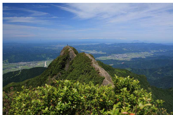
【険しい岩峰からなる山頂部の八ツ峰】