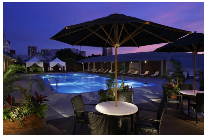
「スカイプール」 ナイトプールイメージ

◎本件に関する報道各位からのお問合せは 株式会社プリンスホテル 高輪・品川マーケティング戦略 TEL: 03-3447-1133(直通) FAX: 03-3473-1115