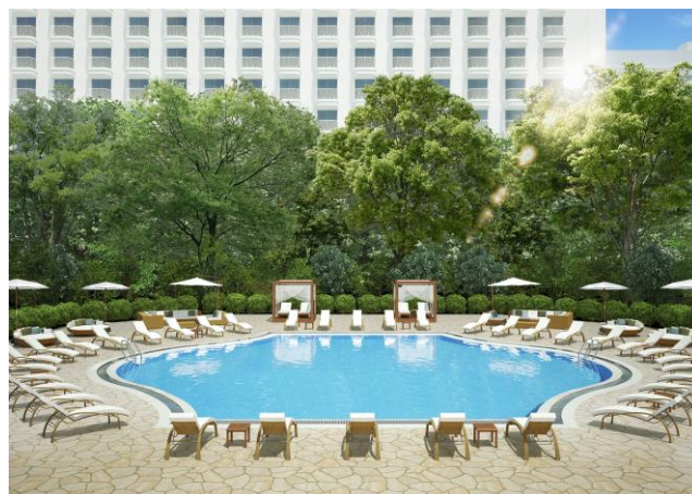
リニューアルイメージ