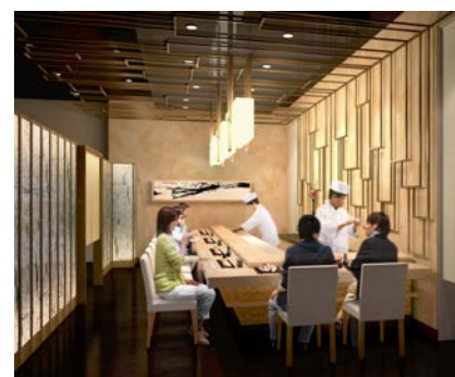
【寿司カウンター(イメージ)】