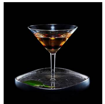
【カクテル(イメージ)】