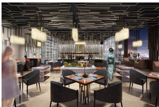
【ダイニングエリア(イメージ)】