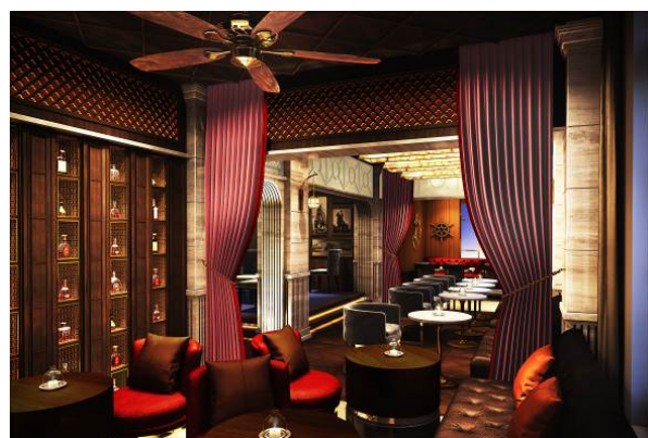
【「L a M a i s o n K i o i」店内 (イメージ)】 【「B a r N a p o l e o n」店内 (イメージ)】

※リリースに掲載の内容は2016年6月6日(月)現在のものであり、変更となる場合がございます。