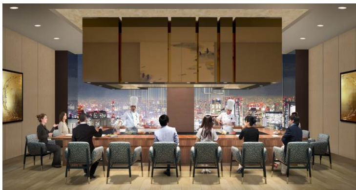
【鉄板焼カウンター(イメージ)】