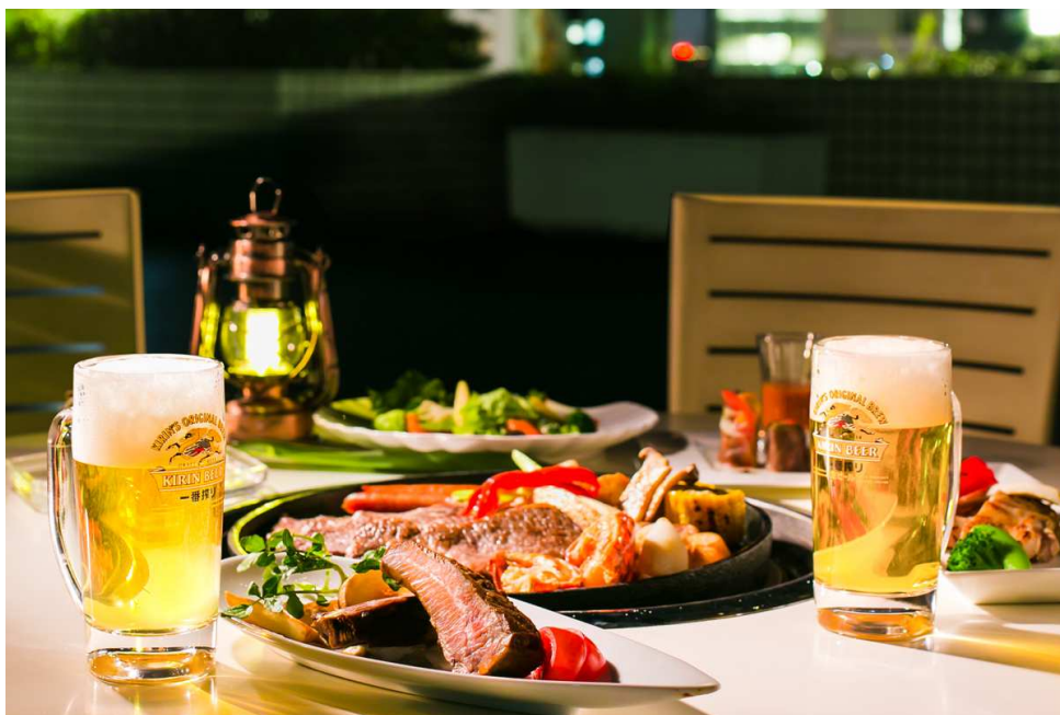
バーベキューイメージ

6月はオープン記念として、バーベキューと飲み放題のセットを特別料金でご利用いただけます。