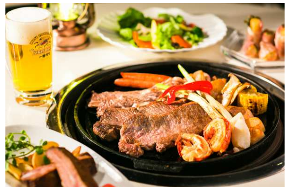
国産牛バーベキューセット（イメージ）

女性ホテリエによるプロジェクトチーム“Happy Ring Project”が考案！