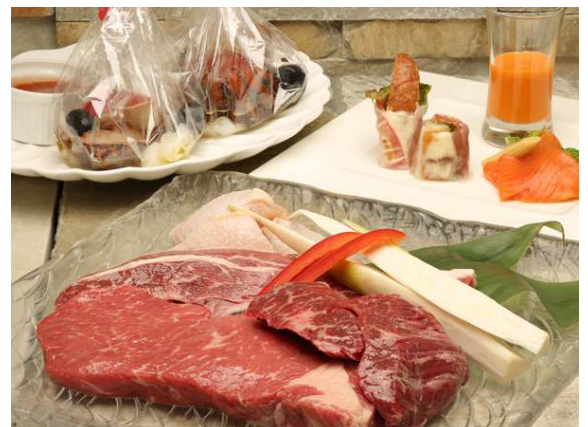
女子会 BBQ セット