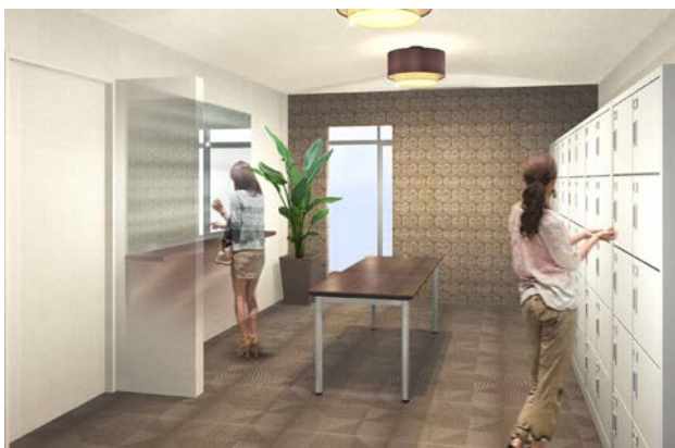
【ロッカールーム イメージ】

海岸出入り口近くに男女別のロッカールームを新設し、海水浴など海のアクティビティの更なる魅力向上を図ります。