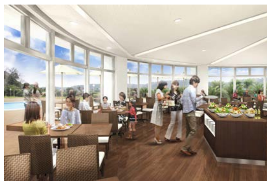
【レストラン「サンルーム」イメージ】

◎本件に関する報道各位からのお問合せ先は 下田プリンスホテル 営業企画 TEL:0558-22-7575(直通) FAX:0558-22-7584 株式会社プリンスホテル プロモーション部 TEL:03-5928-1154 FAX:03-5928-1514