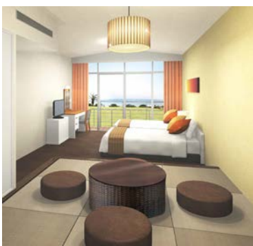
【ファミリールーム1階 イメージ】