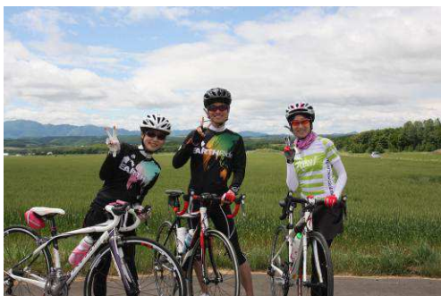
GREAT EARTH の参加者

(※注) 「GREAT EARTH」とは、「地球を遊びつくせ!」を合言葉にさまざまな地で開催されるロングライド、ヒルクライムレース、トレイルランなどのスポーツイベントの総称。「函館大沼」、「岩手雫石」ではロングライドイベントを実施し、本年度それぞれ4回目となります。