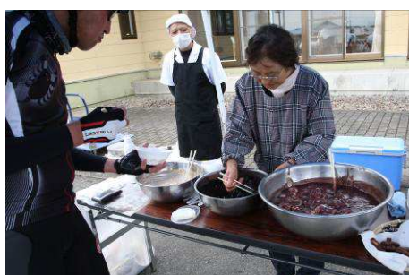
地元の方々のおもてなし