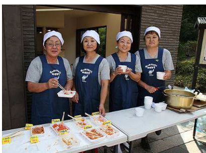
地元の方々のおもてなし