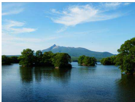
北海道道南の「秀峰駒ヶ岳」を一周