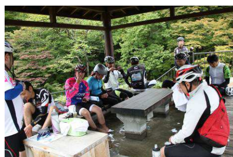
コース途中にある足湯