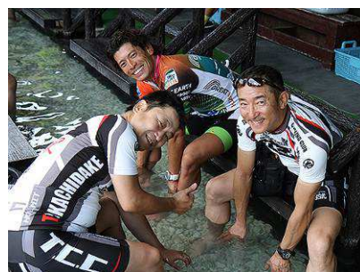
コース途中にある足湯