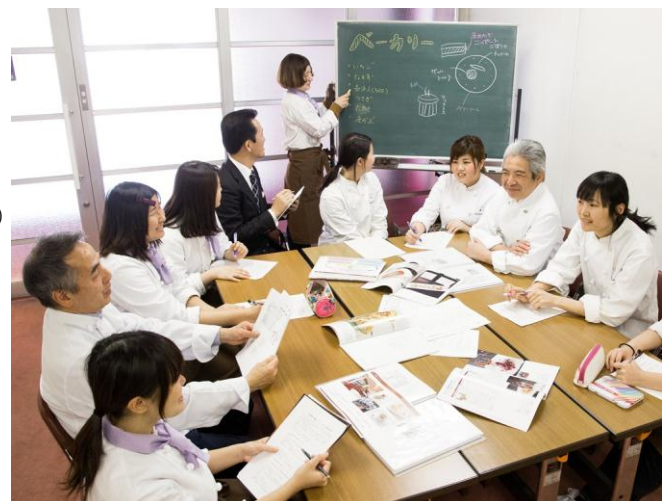
ホテルスタッフとのメニューについてのミーティングの様子