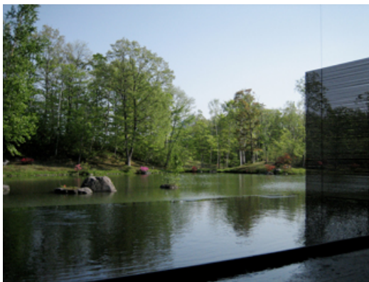
【西大沼温泉「森のゆ」】