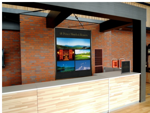
【プリンスホテルウエルカムカウンター (イメージ)】

◎本件に関する報道各位からのお問合せは 函館大沼プリンスホテル 営業1 TEL:0138-67-1115 FAX:0138-67-3660 株式会社プリンスホテル マーケティング部 TEL:03-5928-1154 FAX:03-5928-1514