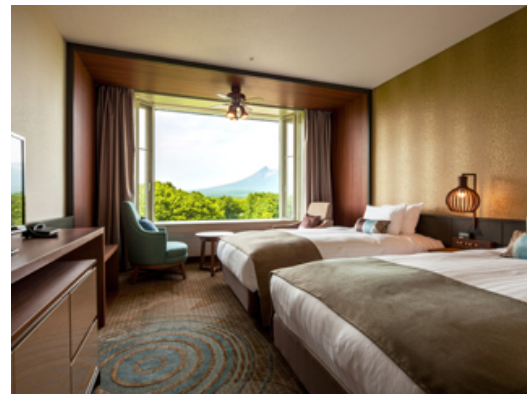
【スーパーアツインマウンテンサイド】