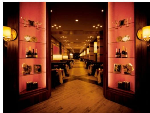
【メインダイニングルーム】