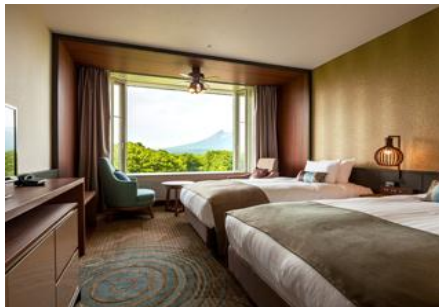
【スーペリアツインマウンテンサイド】