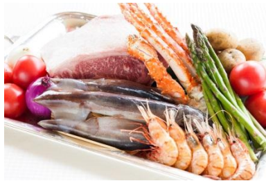
【はこだて大沼黒牛(左上)】