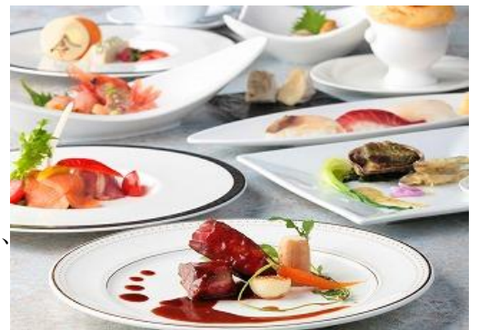
【和洋折衷コース「雅」】