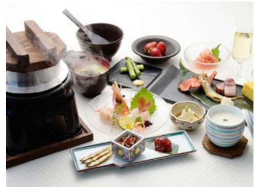
【にっぽんの朝ごはん】