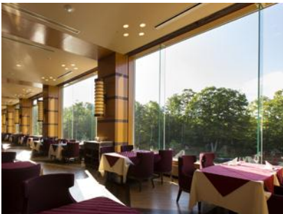
【メインダイニングルーム】