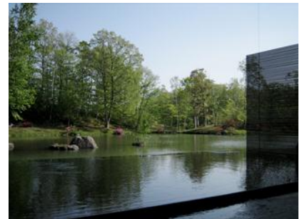
【西大沼温泉「森のゆ」】