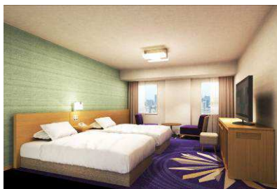
ツイン A (29.3 ㎡・6～24 階・全 85 室)