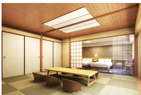
和洋室 (75 ㎡・11～15 階・全 5 室)