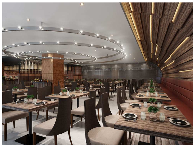
ダイニングエリア