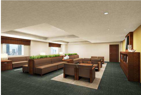
早朝到着・深夜出発便待合室

訪日外国人旅行者の快適性の向上を目的に「早朝到着・深夜出発便待合室」、「ムスリム祈祷室」を新設いたします。