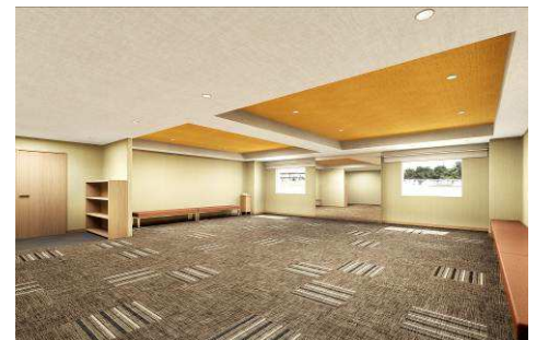
ストレッチルーム

スポーツ団体や企業研修のお客さまに対応(プロジェクタやスクリーンなど、基本機器設置)