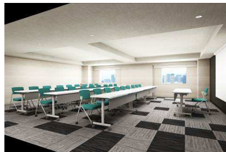
ミーティングルーム