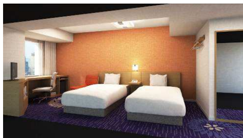
ツイン B (20.7 ㎡・6～24 階・全 322 室)