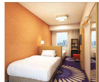
ツイン C (16.6 ㎡・7～12 階・全 72 室)