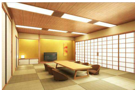
和室 (75 ㎡・6～10 階・全 5 室)