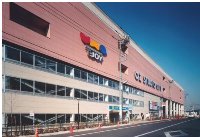
オズスタジオシティ外観