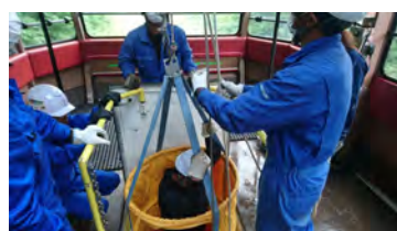
ロープウェイ救助訓練