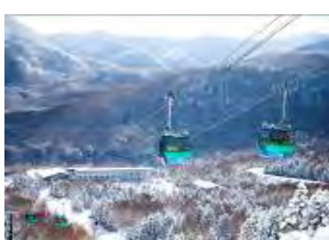
志賀高原焼額山スキー場