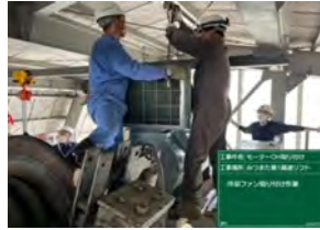
みつまた第1高速リフト モーターオーバーホール