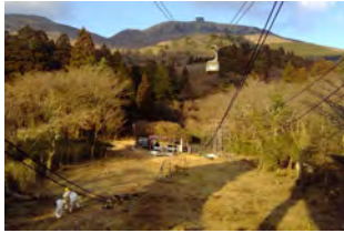
箱根駒ヶ岳ロープウェー えい索交換・平衡索交換