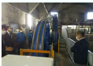
安全統括管理者による巡回