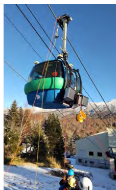
ゴンドラ救助訓練