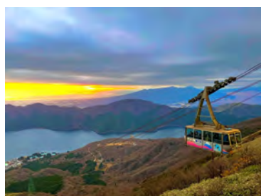
箱根駒ヶ岳ロープウェー