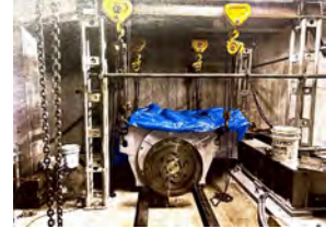
焼額山第1ゴンドラ 原動機更新工事