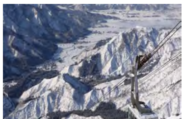
六日町八海山スキー場