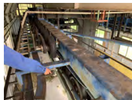
妙高三田原第2高速リフト 山頂保安装置追加