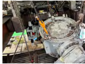
軽井沢イースト高速リフト 減速機オーバーホール