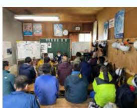
社員教育／受け入れ教育