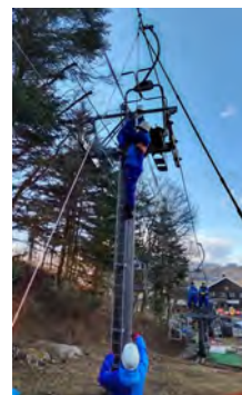
ロマンスリフト救助訓練