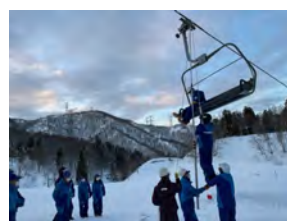
高速リフト救助訓練