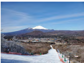
軽井沢プリンスホテルスキー場