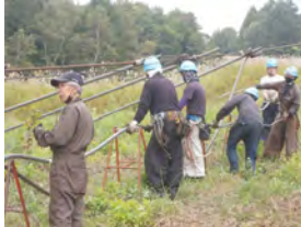
妙高三田原第2高速リフト 索条更新工事