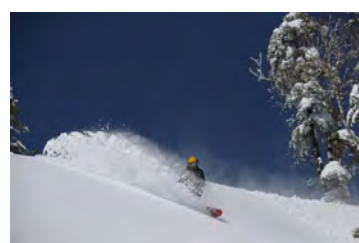
万座温泉スキー場